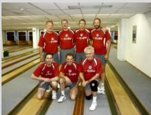
v. l. Hertha BSC Berlin