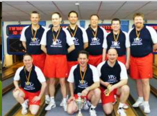
SG ETV / Phönix Kiel

Kegeln kann ja sooooo schön sein, wenn man gewinnt! Halstenbek geht in Fehrbellin unter