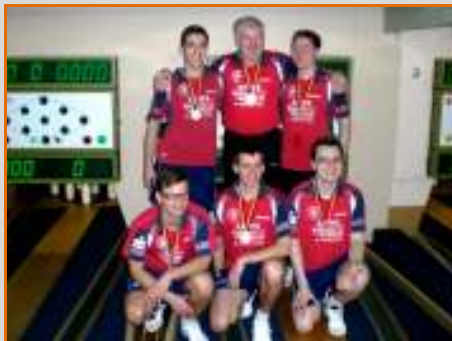
Vizemeister SV 90 Fehrbellin

1. Bundesliga Herren - 3. und 4. Spieltag 08. / 09.10.2011 - SV 90 Fehrbellin