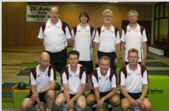
v.l. - KSV Halstenbek

4. Spieltag - SV 90 Fehrbellin gegen Deutscher Meister 2010/2011 SG ETV / Phönix Kiel