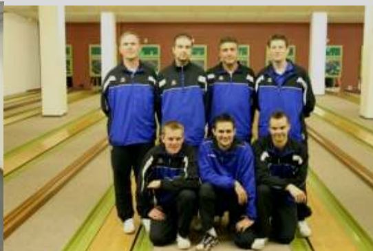
NKC 72 Berlin

SVL Seedorf hat Hertha ein Bein gestellt Auswärtserfolg der Seedorfer