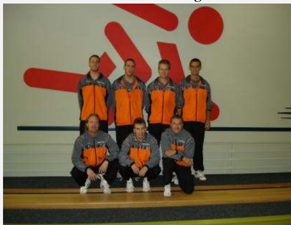
KSK Hamburg 46

FEHRBELLIN - Der Bundesligaspielplan will es so. Nach den beiden Heimspielen gegen Halstenbek und Kiel haben die Bundesligaspieler des SV 90 Fehrbellin im Oktober auch am dritten Doppelspieltag Heimrecht. Gäste sind diesmal der KSK Hamburg 46 und Rivalen Hannover.