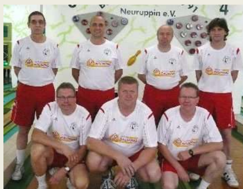
Spitzenreiter BBC 91 Neuruppin II

Beim dritten Turnier am Samstag in Brandenburg belegte der BBC 91 II hinter den Gastgebern der SG Rot-Weiß Brandenburg 51 den zweiten Rang vor dem SVL Seedorf II und der SpG Rolandstadt Perleberg. Nach 3 von acht Wettkämpfen haben die Fontane Städter bereits 10 wichtige Punkte im Kampf um den Klassenerhalt gesammelt. Der