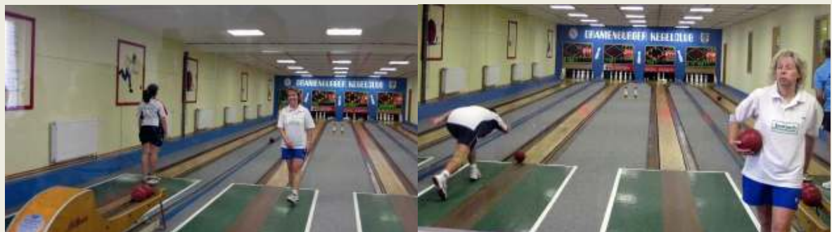
Auch Gaby (Michendorf) war lange auf Rekordniveau, schaffte es am Ende nicht ganz. Im letzten Durchgang musste Eva (links) starke Nerven zeigen.