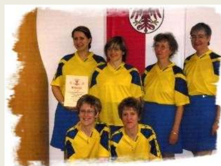
Aufsteiger Luckenwalder KV 1925

Teams der Staffel 2 Vizemeister BBC 91 Neuruppin, Motor Hennigsdorf (Bronze – Gewinner), ESV Lok Seddin, Luckenwalder KV 1925