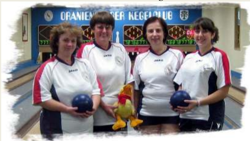
Aufsteiger Oranienburger KC

Teams der Staffel 1 SC Einheit Luckau amtierender Landesmeister, KSV Altdöbern 1992, KCP Michendorf, Oranienburger KC