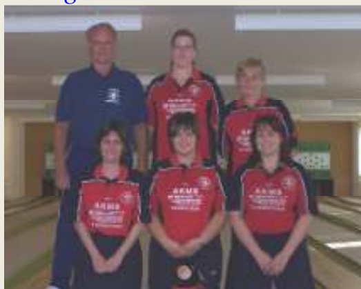
SV 90 Fehrbellin