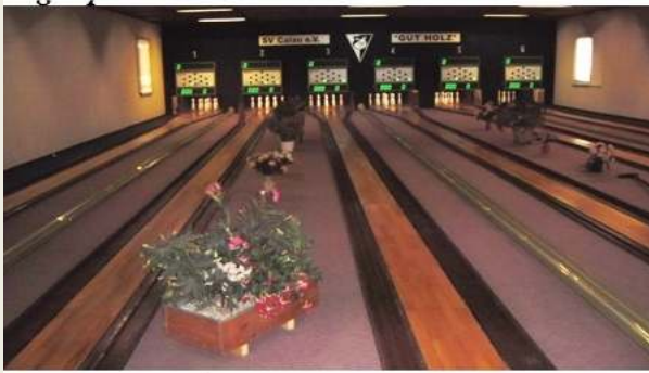
Kegelsporthalle SV Calau